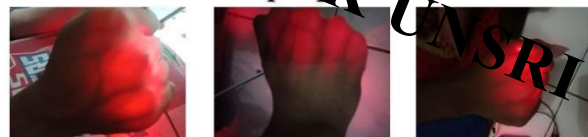
Gambar 2. Hasil Visualisasi Alat Portable SIVV