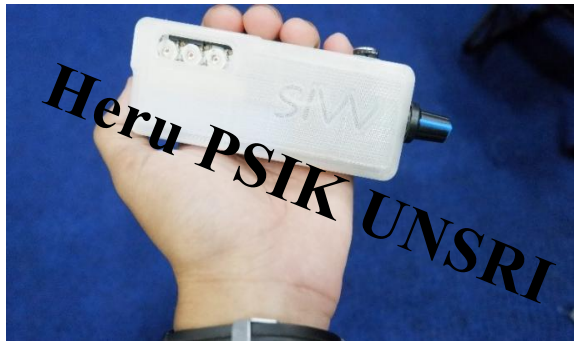
Gambar 3. Realisasi Alat Portable SIVV

Alat pemindai pembuluh darah vena metakarpal ini telah di ujicobakan pada 14 orang responden perawat dan dinilai praktis untuk bisa digunakan dalam tindakan vaskulerisasi dan juga alat ini nyaman saat digunakan oleh 20 responden mahasiswa. Alat ini dapat menampilkan visualisasi vena metakarpal menjadi lebih besar, nyaman untuk digunakan serta memiliki bentuk yang mudah untuk digenggam.